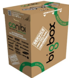
BIGBOX 150 litres 70 cm X 60cm X 40cm