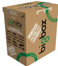
BIGBOX 150 litres 70 cm X 60cm X 40cm