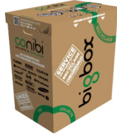
BIGBOX 150 litres 70 cm X 60cm X 40cm