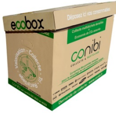
ECOBX 100 litres 45 cm X 60 cm X 40 cm

Dès la première collecte (*), nous vous livrons des contenants adaptés pour regrouper vos consommables usagés :